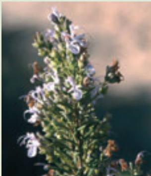
Flores del romero

En la Devesa se pueden descubrir las posibilidades del sentido del olfato, con la existencia de diversas plantas aromáticas durante todas las estaciones del año. El lentisco desprende un olor áspero muy particular durante todo el año, la zarzaparrilla perfuma el ambiente con sus ramilletes de flores blancas al final del verano, el romero emana continuamente un olor muy sugestivo, la madreselva, de dulce aroma y la siempreviva, con su amargo olor silvestre, inundan en primavera toda la Devesa, las pequeñas y numerosas flores blancas del mastuerzo marítimo despiden, sobre todo en invierno, una deliciosa fragancia a miel... Todos estos olores contrastan con el desagradable olor que desprende la ruda cuando se pisa o se roza.