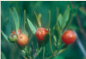
Frutos del bayón