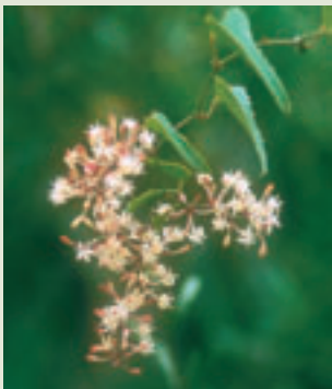
Flores de la zarzaparrilla

Después de llover, pasear por la Devesa es una experiencia muy gratificante, por el agradable olor que desprende la tierra mojada. Con la lluvia se agudizan todos y cada uno de los olores propios de plantas y flores de la zona.