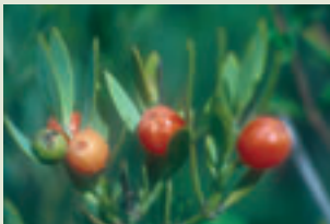
Frutos del bayón