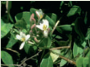
Flores de la madreSelva

La mayor parte de la información que recibe nuestro cerebro nos llega a través de la vista.