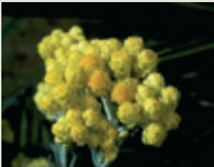
Flores de siempreviva