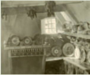
Interior Barraca de Montoliu