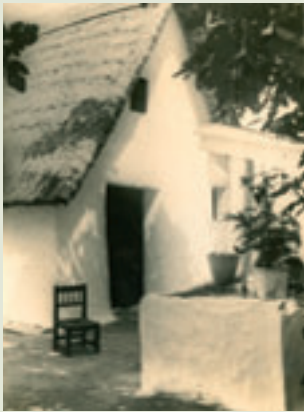
Pou y Barraca

Desde esta parada se puede observar la Mallada de El Saler. De las malladas se obtenían algunos de los materiales empleados para la construcción de lo que era la vivienda tradicional de la zona, la barraca.