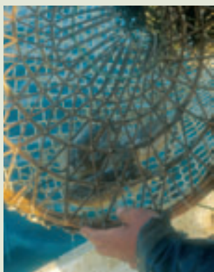
Pesca de la sepia

Los habitantes del pueblo de El Saler han aprovechado tradicionalmente muchos de los recursos naturales que les ha brindado el bosque de la Devesa. Destacan, entre otros, el uso de las ramas del rusco o galcerán para la pesca de la sepia, el de las ramas del jaguarzo blanco o estepa d'arenal para proteger de los malos espíritus a alguien que caía enfermo o moría, el de las ramas del mirto y del lentisco para la confección de alfombras utilizadas para engalanar los suelos de las calles en las procesiones y fiestas, el de las cenizas de las sosas para producir jabón, la raíz del lirio amarillo o lliri groc para buscar y conservar el amor, y el de la madera de diferentes arbustos, sobre todo del espino negro, como combustible para los hornos.