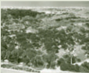
Muntanyar de la Mona, años 60