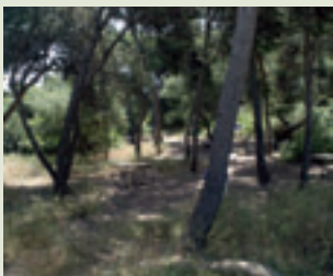
Muntanyar de la Mona

En torno a esta parada, se encuentra una zona usada desde hace tiempo, como área de esparcimiento llamada El Muntanyar de la Mona. Su nombre posiblemente esté relacionado con “La Mona de Pascua”. Esta zona de matorral abierto, cerca del mar, con sombra y próxima al pueblo de El Saler la harían idónea para merendar la “mona” (tradición con arraigo en la que el lunes de Pascua, familias y grupos de amigos merendaban juntos la “mona”).