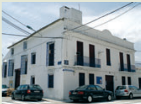
Casa de la Demanà

El nombre de "El Saler" hace, seguramente, referencia a un conjunto de barracas situadas donde actualmente está el pueblo y en las que se almacenaba la sal que procedía de las antiguas salinas localizadas cerca de la zona conocida hoy, como "Racó de l'Olla". El crecimiento poblacional originado alrededor de estas barracas, parece ser que fue el origen del pueblo de El Saler.